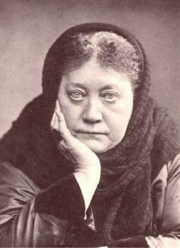
Helena Petrovna Blavatsky

1884 – Büyük Britanya’da sosyalizmi yaymak amacıyla Fabian Derneği kuruldu. Fabian Derneği ismini Romalı General Fabius Maximus’tan almaktadır. Maximus, Hannibal’in ordusu ile savaşmış, bu sırada belirleyici bir savaş yerine, küçük yıpratıcı saldırılar gerçekleştirmiştir.