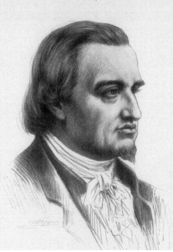
Mayer Amschel Rothschild

1 Mayıs 1776 – Adam Weishaupt (Kod ismi; Spartacus) Illuminati adını verdiği gizli bir topluluk kurdu. Weishaupt, Almanya'nın Bavyera eyaletinde bulunan Ingolstadt Üniversitesi'nde profesör olarak görev yapıyordu.