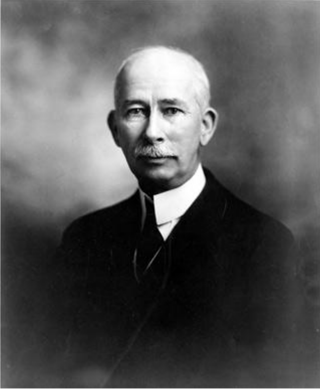
Colonel Edward Mandell House

3 Şubat 1913 – Amerikan Anayasası’nda yapılan değişiklikle Federal Hükümete artan oranlı gelir vergisi uygulama olanağı sağlandı. Artan oranlı gelir vergisi Komünist Manifesto’nun 2. Maddesi’nde ifade edilmekteydi. (Kanada’da gelir vergisi 1917 senesinde savaşı finanse edecek “geçici bir tedbir” olarak yürürlüğe girmişti.)