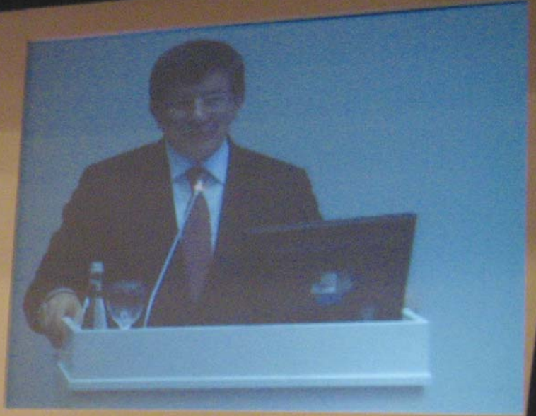
Suriye Türkmenleri Platformu 1. Toplantısına katılan Dışişleri Bakanı Davutoğlu Türkiye'nin Suriye Türkmenlerine destek vereceği taahhüdünde bulunmuştur.

Türkmen askeri birliklerle en derin ilişkiye sahip olduğu bölge Bayır-Bucak'tır ve yönetimin de önemli bir kısmını Bayır-Bucaklılar oluşturmaktadır. Kitle, Suriye içinde etkili olmak ve sahaya yönelik çalışmak stratejisi çerçevesinde ilk adım olarak Suriye sınır bölgelerinde irtibat büroları kurmuştur. İlk olarak Yayladağı, ardından Akçakale ve sonrasında Gaziantep ofisleri açılmıştır. Bu ofisler sayesinde Kitle'nin Suriye Türkmen bölgeleri ile yakın irtibatı sağlanmaktadır. Yayladağı Ofisi Lazkiye Türkmenlerine, Gaziantep ofisi Halep Türkmenlerine ve Akçakale ofisi Rakka Türkmenlerine yönelik olarak faaliyet göstermektedir.