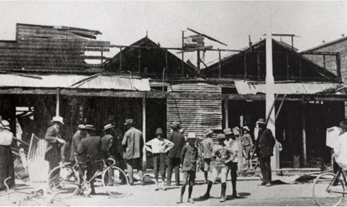
Saldırı sonrası halkın ateşe verdiği Alman kulüp binası