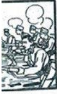
تاریخ انتشار: دوشنبه ۱۰ آذر ۱۳۰۱

ملاقات امین اجهیلی و دون صاحب استاذ، لومیریزک و مسرد لومیریزک تشکری و مسرد لومیریزک تشکری و مسرد لومیریزک تشکری