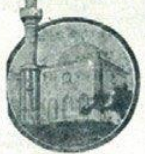
دوشنبه انبارا، هر وسایلی لایمورک انا کولک باغون

شاهین جامع بی شورازار، نایت اولدی، دون اوزک موشی، ارمیره کیردی، امانت دوت چیده، علامتارا دور، سالن مالک از بازاری و حیوانی کاشیانی آرمسته، شهره فانیل ۳۰۰۰۰ لری ۲۴ کولک بر غزایدن سورکه، زمین: آقار، نازار، نورلا، مشهور.