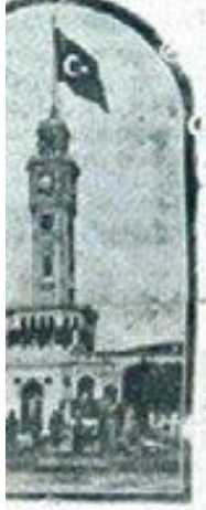
تاریخ انتشار: دوشنبه ۱۰ آذر ۱۳۰۱

مل اردو ارمیره کیردی، امانت دوت چیده، علامتارا دور، سالن مالک از بازاری و حیوانی کاشیانی آرمسته، شهره فانیل ۳۰۰۰۰ لری ۲۴ کولک بر غزایدن سورکه، زمین: آقار، نازار، نورلا، مشهور.