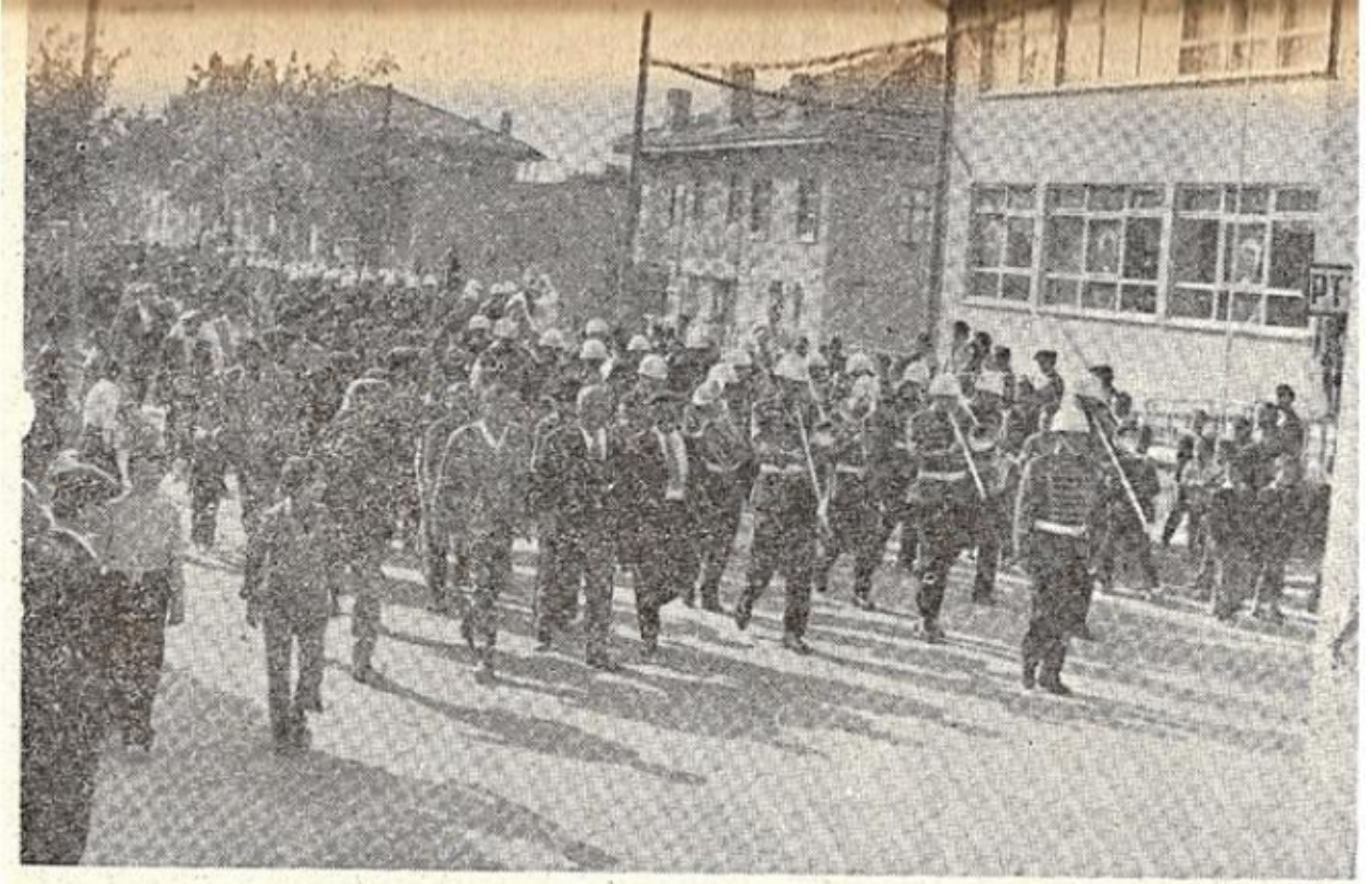
17 Eylül 1976 tarihinde kutlanan Gelendost Zaferinin 800. üncü Yıldönümü törenlerine gelen askeri birliğin karşılanması.