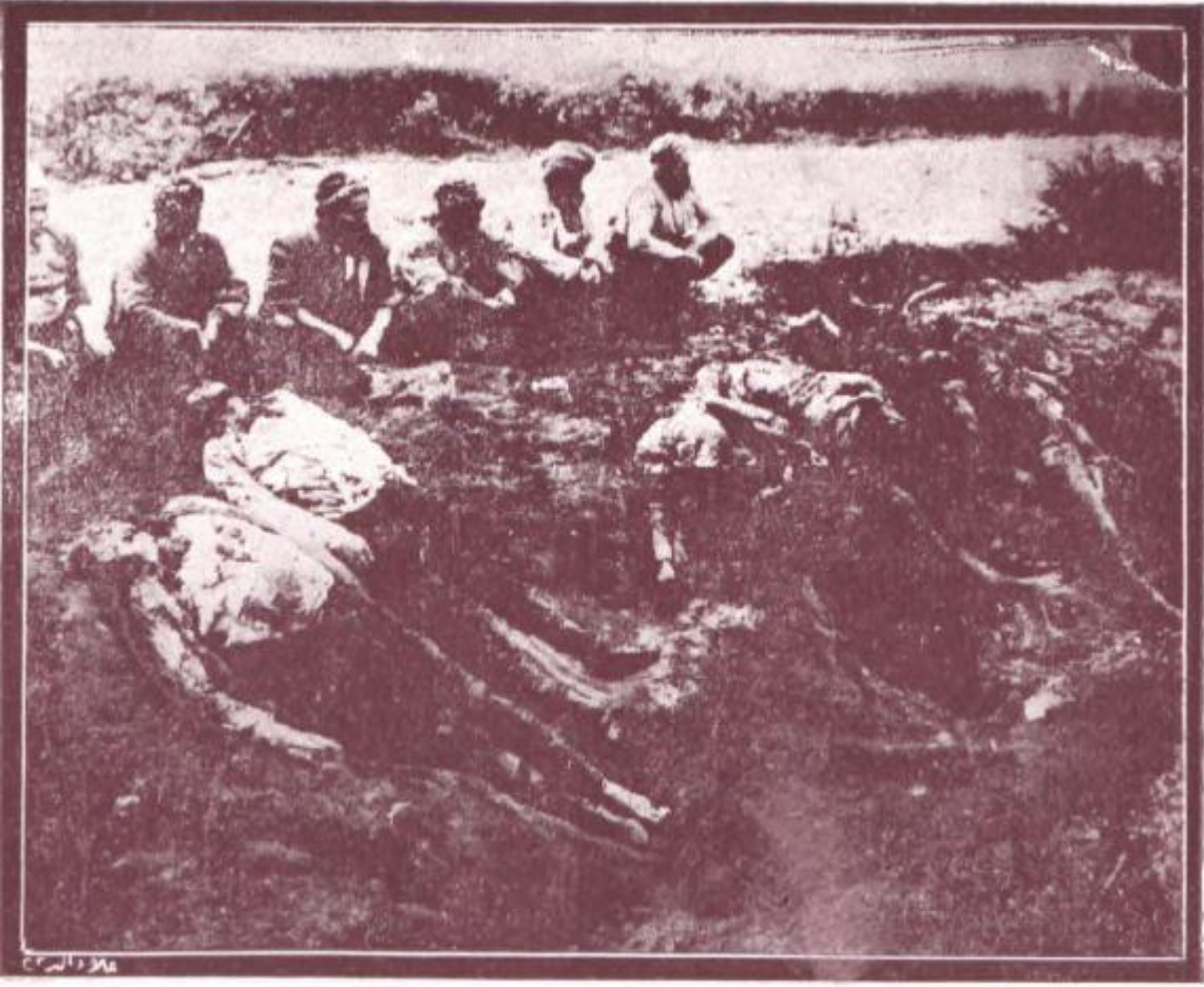
یکشہردہ یونان مظالمندان Les atrocités grecques à YENI-CHÉHIR

İstiklâl Harbi esnasında Yunan zulmünü anlatmak amacıyla Yenişehir bölgesinde çekilmiş bir fotoğraf