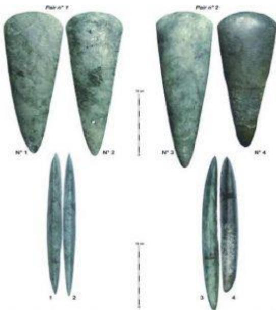
Yeşim Taşından Baltalar

Daha sonra daha kuzeye doğru yola çıktı. Tüm karaları çevirdiğini düşündükleri denize dek geldiler. Bu gün Norveç denilen bu yere de oğlu Saming'i kral yaptı. Haleygja Anlatısı'nda belirtildiği gibi tüm Norveç kralları, vezirleri (Jarl: Başbakan) ve diğer büyük adamlar onun soyundan türemişlerdir. Oden'in yanında kendinden sonra gelecek olan ve şimdi İsveç (Svitjod) Kralı olan oğlu Yngve vardı. Onun soyundan gelenlere de Yngingler (Ynglingar) denecekti.” [8]