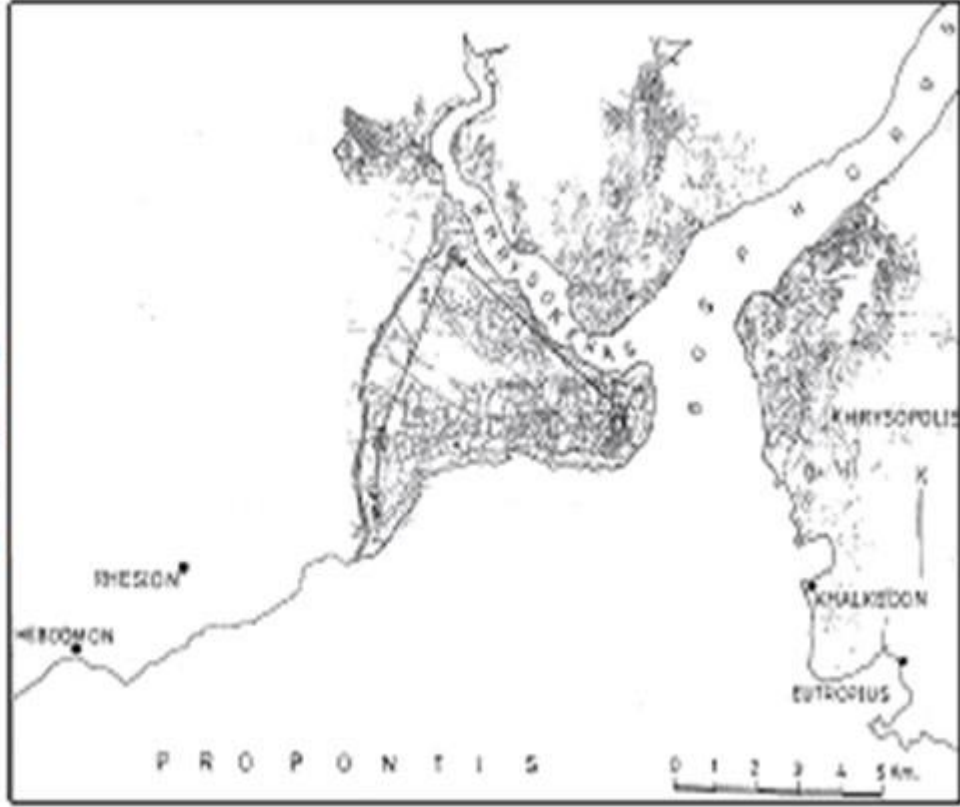
Harita 2: İstanbul'un suriçi bölgesi ve surdışında Rhesion ve Hebdomon. (Düzgüner, 2004, 15.)