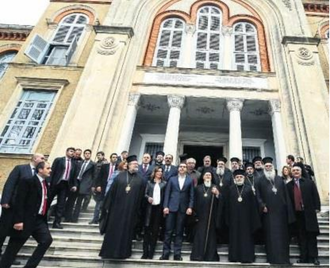
HEYBELİADA RUM ORTODOKS PAPAZ MEKTEBİ (Ruhban Okulu)