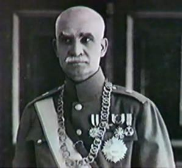
Reza Han Pehlevi

İkinci Dünya Savaşı döneminde Nazi Almanyası ile olan yakın bağları nedeniyle İngiltere ve Sovyet Rusya'nın hedefi haline gelen Şah Reza Han Pehlevi, ülkesinin bu iki büyük güç tarafından işgal edilmesine engel olamamış ve sonuçta tahtını oğlu Muhammed Rıza Pehlevi'ye devretmek zorunda kalarak, sürgüne gönderilmiştir.[13] 1941 yılında başa geçen Rıza Pehlevi, ilk iş olarak işgal kuvvetlerinin kısa sürede geri çekilmesi karşılığında onlarla bir antlaşma imzalayarak 1943'te Almanya'ya savaş açmış ve sarsılan Şahlık otoritesini İngiltere desteğiyle ayakta tutmayı başarmıştır.[14] İkinci Dünya Savaşı sonrasında oluşan Soğuk Savaş döneminde İngiltere, Sovyet Rusya ve Amerika Birleşik Devletleri gibi ülkelerin etkisi altında kalan ve enerji kaynaklarını büyük ölçüde bu