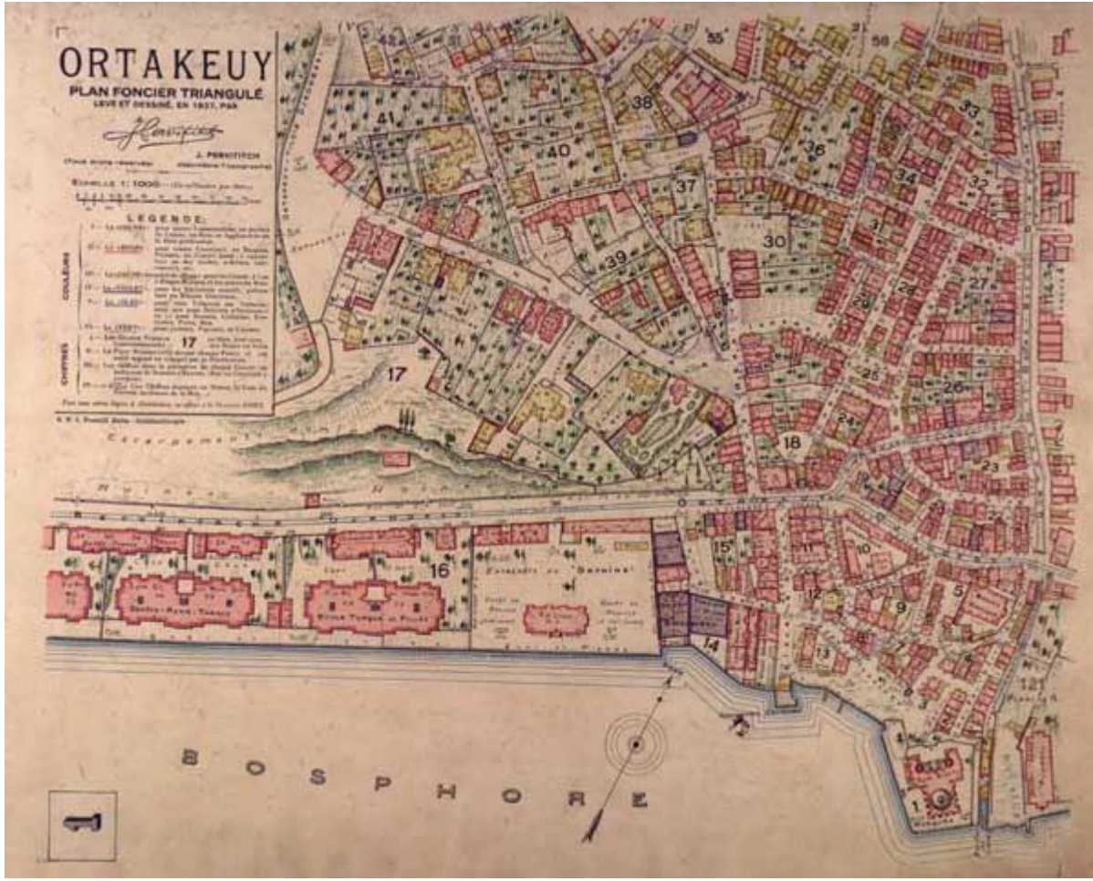
Pervititch'in Ortaköy haritası, 1927.

pervititch, istanbul'un şehir mimarisi ve sokakları üzerine araştırma yapmak, şehrin sokak sokak bir haritasını çıkarmak için uzun araştırmalar yapmıştı ve yolu elbette belediye'ye de düşmüştü.