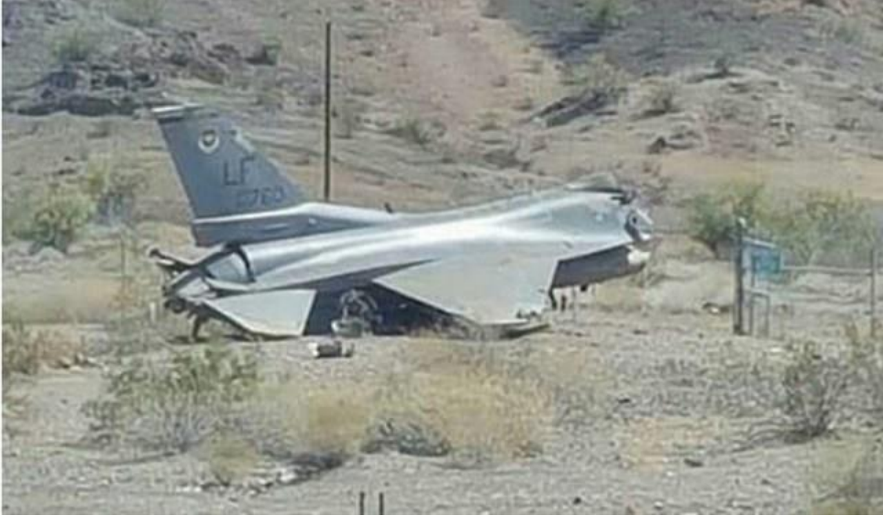
Arizona'da düşen ABD Hava Kuvvetlerine ait bir savaş uçağı

1) Müritler, yukarıda tarif etmeye çalıştığımız sebeplerden dolayı uçuş eğitiminde ciddi oranda başarısız olabilirler. Savaş pilotu yetiştirmek çok meşakkatli, çok pahalı ve çok zaman alan bir iştir. Bakın darbe girişimi üzerinden üç sene geçti. Bu süre zarfında yetiştirebildiğimiz F-16 pilotu sayısı 10-15'ten fazla değildir. Çok ciddi savaş pilotu açığımızın olduğu bu dönemde seçilen adayların eğitimde başarısız olmaları bırakın harcanan para ve emeği, ciddi anlamda zaman kaybına neden olur.