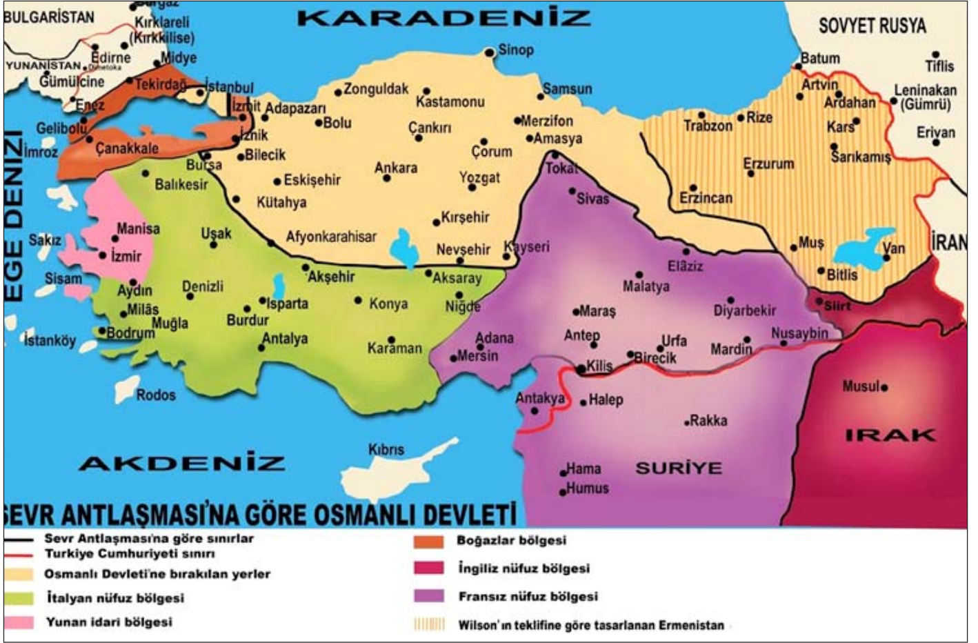
Şekil 3. Sevr Antlaşması'nda Öngörülen Paylaşım

tırma merkezinde görevli eski İngiliz diplomat ve istihbaratçı Richard Barrett'in Haziran 2014'te yayımladığı "Suriye'deki Yabancı Savaşçılar" 5 raporu örgüte yabancıların katılımının arttığını gözler önüne sermektedir. Raporu göre Suriye'deki çatışmaların başladığı tarihten itibaren 12.000 yabancı savaşçı destek için örgüte katılmıştır. Bu katılımın yüzde 25'ini Batılı devletlerden gidenler oluşturmaktadır (Rapor, s4).