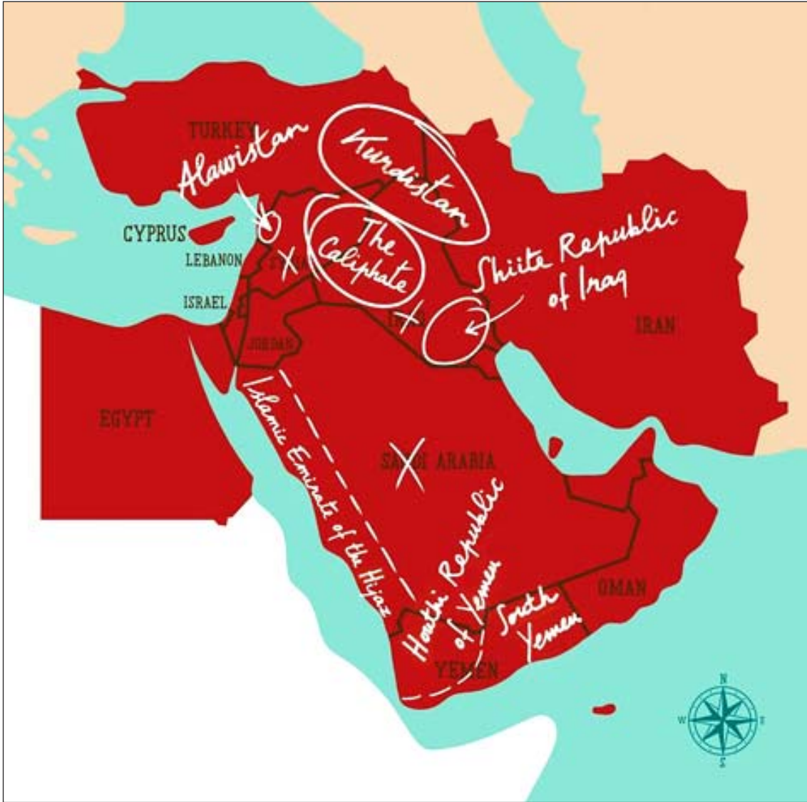
Şekil 1. Wall Street Journal'daki maktelede Tasvir Edilmiş Harita

Kaynak: Yaroslav Trofimov, Would New Borders Mean Less Conflict in The Middle East, Harita Tasarım: Luci Gutierrez