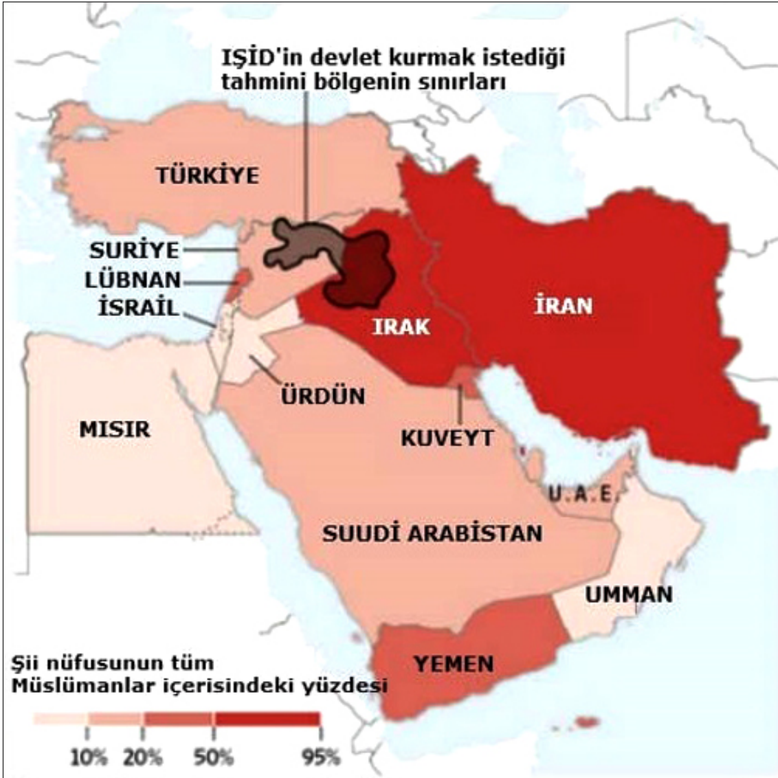
Şekil 4. IŞİD'in Kurmak İstedığı Devletin Tahmini Sınırları