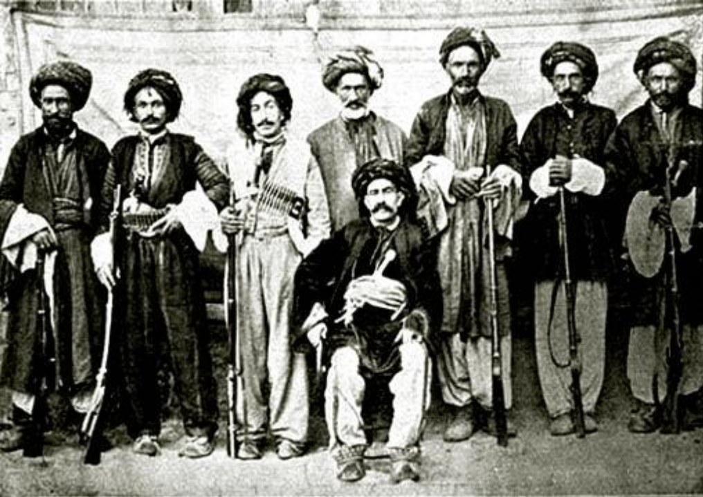
c. Kürt Teavün ve Terakki Cemiyeti :

“Şu medeniyet dünyasında ve bu ilerleme ve yarış çağında diğer arkadaşları gibi Kürtlerin de ilerlemeye ayak uydurabilmesi için hükümetin yardımı ile Kürdistan'ın kasaba ve köylerindeki mekteplerin kurulmuş olması memnuniyetle görülmekte ise de bu mekteplerden Türkçe'yi az da olsa öğrenmiş olan çocuklar ancak yararlanabilmektedir. Türkçe'yi bilmeyen Kürt çocukları ise, medreselerde okutulan ilimleri terakki etmenin biricik kaynağı olarak bilmektedirler. Yeni açılan bu mekteplerdeki öğretmenlerin mahalli dili (Kürtçe) bilmemeleri dolayısıyla bu çocukları eğitim ve öğretimden mahrum bırakmaktadır. Bu ise vahşete, karışıklığa, dolayısıyla batının gürültü ve patırtı çıkarmasına sebep oluyor. Aynı zamanda halkın devamlı olarak vahşet ve taklitte yerinde sayması, sürekli olarak vehim ve şüphelerin etkisi altında kalmalarına sebep oluyor. Eskiden her yönden Kürtlerden geri olanlar bugün onların hala yerinde saymalarından dolayı çeşitli şekillerde istifade etmektedirler. Bu ise, biraz olsun hamiyet duygusu taşıyanları düşündürür. Bu üç nokta, Kürtler için gelecekte korkunç bir darbe hazırlıyor gibi ileri görüşlü olan kimseleri yaralamıştır. Bunun çaresi, örnek olacak şekilde bu konuda teşvik ve rağbete öncülük yapması için Kürdistan'ın farklı yerlerinde yeni medreselerin açılması ve bir kısım medreselerin de canlandırılması, Kürdistan'ın maddi ve manevi olarak geleceğinin garanti edilmesi açısından önemlidir.”