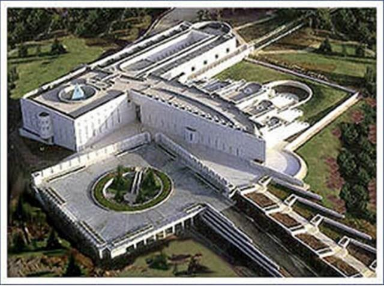
İsrail Anayasa Mahkemesi.

Orta Doğu: Genellikle Benjamin Netanyahu tarafından kontrol edilmektedir. Bu adamın elinde inanılmaz büyüklükte yetkiler bulunmaktadır. Daha önce de belirttiğim gibi İsrail, Illuminati'nin büyük kukla devletidir . Illuminati'nin bütün istediklerini hiç düşünmeden, elinden gelenin en iyisini yaparak yerine getirir. İsrail'e istediği zaman İran'a ateş açma yetkisi verilmiştir. Orta Doğu'nun kontrolü, bu bölgede birçok isyancı grup olduğu için zordur. Filistin hakkında endişelenmeye dahi gerek yoktur. Bu ülke, Illuminati tarafından kontrol edilmese de bir şey yapabilecek durumda değildir. İran herşeye karşı çıkmaktadır ve bu nedenle Üçüncü Dünya Savaşını başlatmak için İsrail İran'ı yok edecektir.