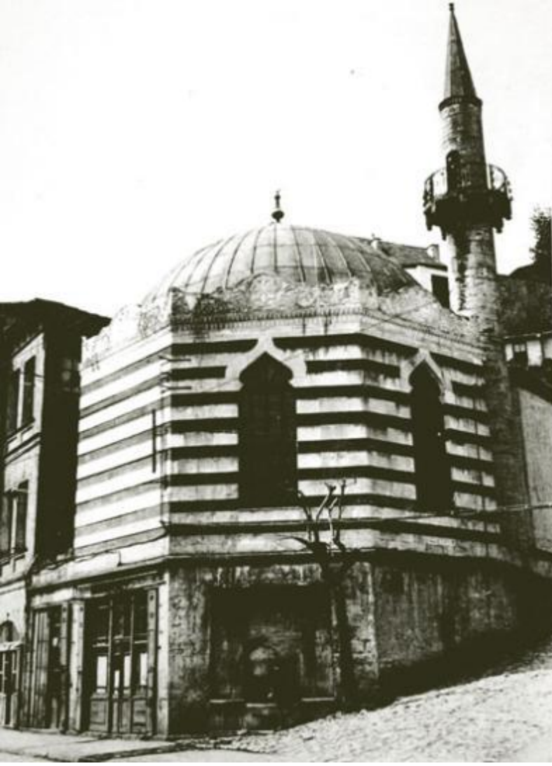
İstanbul'da yol yapım çalışmaları sırasında 1957'de yıkılan Süheyl Bey Camii (yakından görünüm)