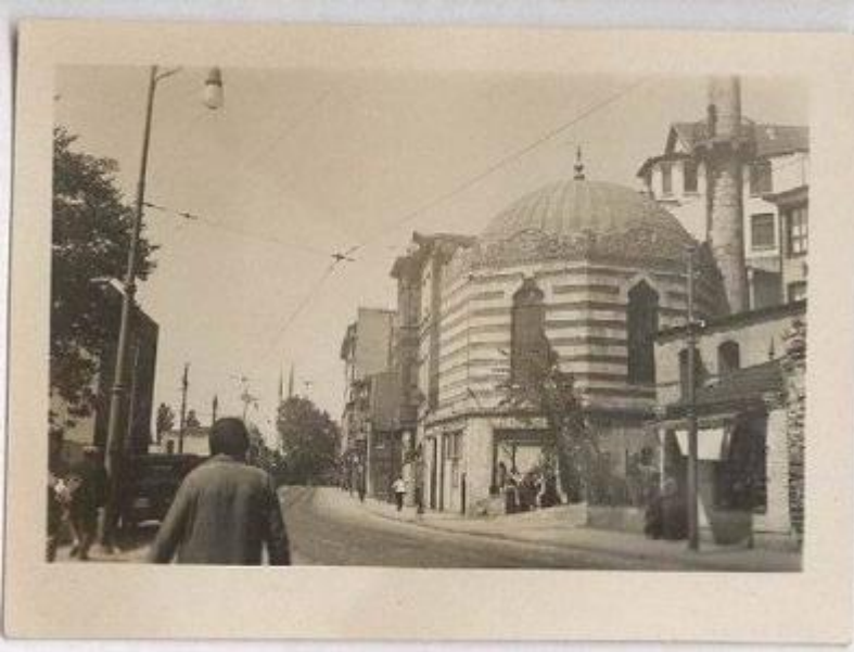
İstanbul'da yol yapım çalışmaları sırasında 1957'de yıkılan Süheyl Bey Camii (uzaktan görünüm)