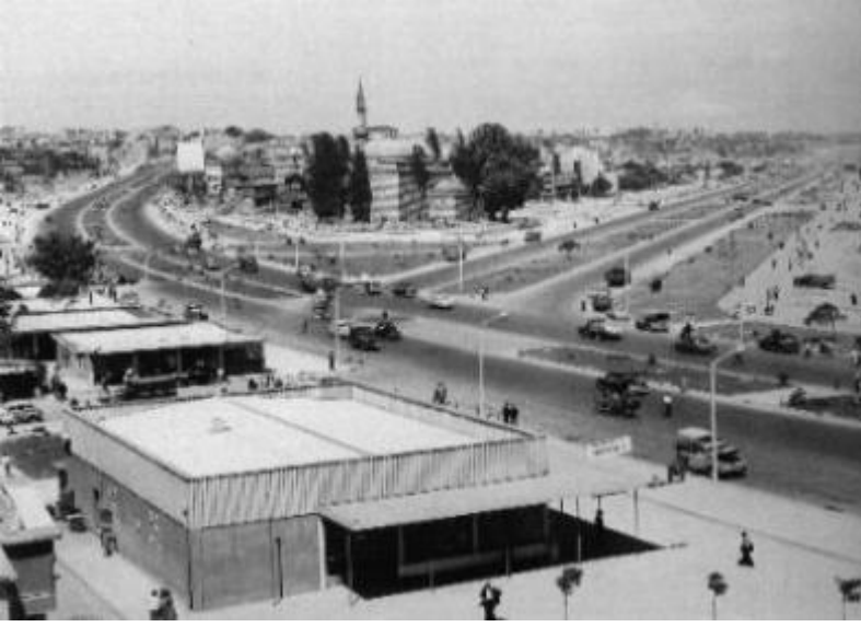
İstanbul'da yol yapım çalışmaları sırasında 1957'de yıkılan Murat Paşa Camii (uzaktan görünüm)