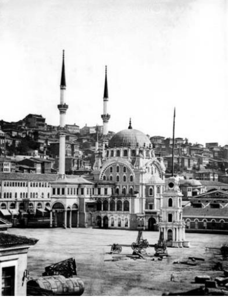
İstanbul'da yol yapım çalışmaları sırasında 1958'de bazı bölümleri yıkılıp yeniden yapılan Nusretiye Camii