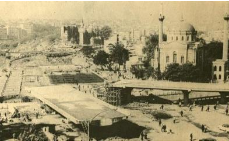
DP ve Menderes döneminde İstanbul Aksaray'da Vatan Caddesi yapılırken birçok tarihi cami yıkılmış ve zarar görmüştür