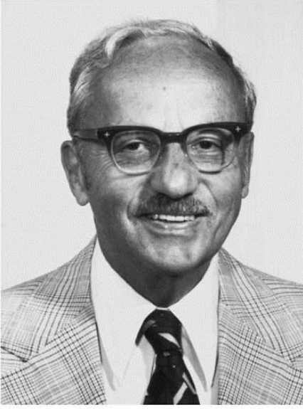
George B. Dantzig

“Berkeley’de California Üniversitesi Matematik Bölümü Öğrencisiydim. Her zaman ki gibi sınıfa geç girdim ve tahtadaki iki istatistik sorusunu ev ödevi sanarak defterime geçirdim. O akşam, soruların üzerinde çalışırken bunun profesörün verdiği en zor ödev olduğunu düşündüm. Her gece, başaramasam da sırasıyla her iki problemin üzerinde saatlerce çalıştım.