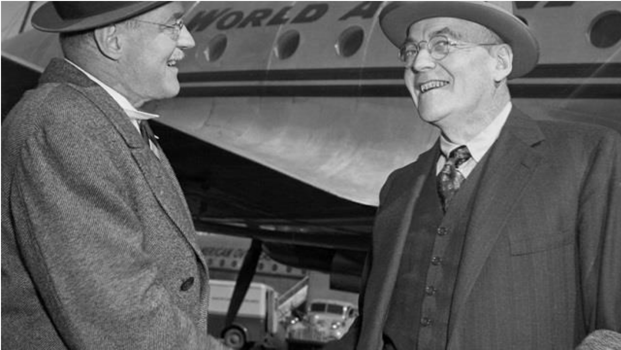
1948 yılında Dulles Kardeşler: Allen (solda) ve John Foster (sağda).

Franklin D. Roosevelt, eli çok güçlü olan Winston Churchill ve diğer müttefik liderlere, Birleşik Devletlerin faşizme karşı sürdürülen Avrupa savaşına desteğinin ön koşulu olarak, 14 Ağustos 1941 tarihinde Atlantik Bildirisini imzalatmıştır.