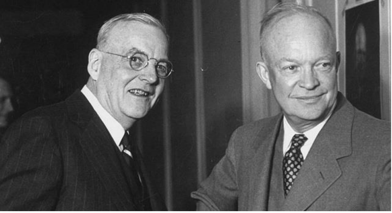
John Foster Dulles (solda) ve Başkan Eisenhower, 1952.

Kısmen de olsa babam bir Arap tarafından öldürüldüğünden, Birleşik Devletler politikasının Orta Doğu üzerindeki etkilerini ve özellikle de ülkemize karşı ara sıra İslam dünyasından gelen kana susamış tepkilere neden olan faktörleri anlamak için bir çaba gösterdim.