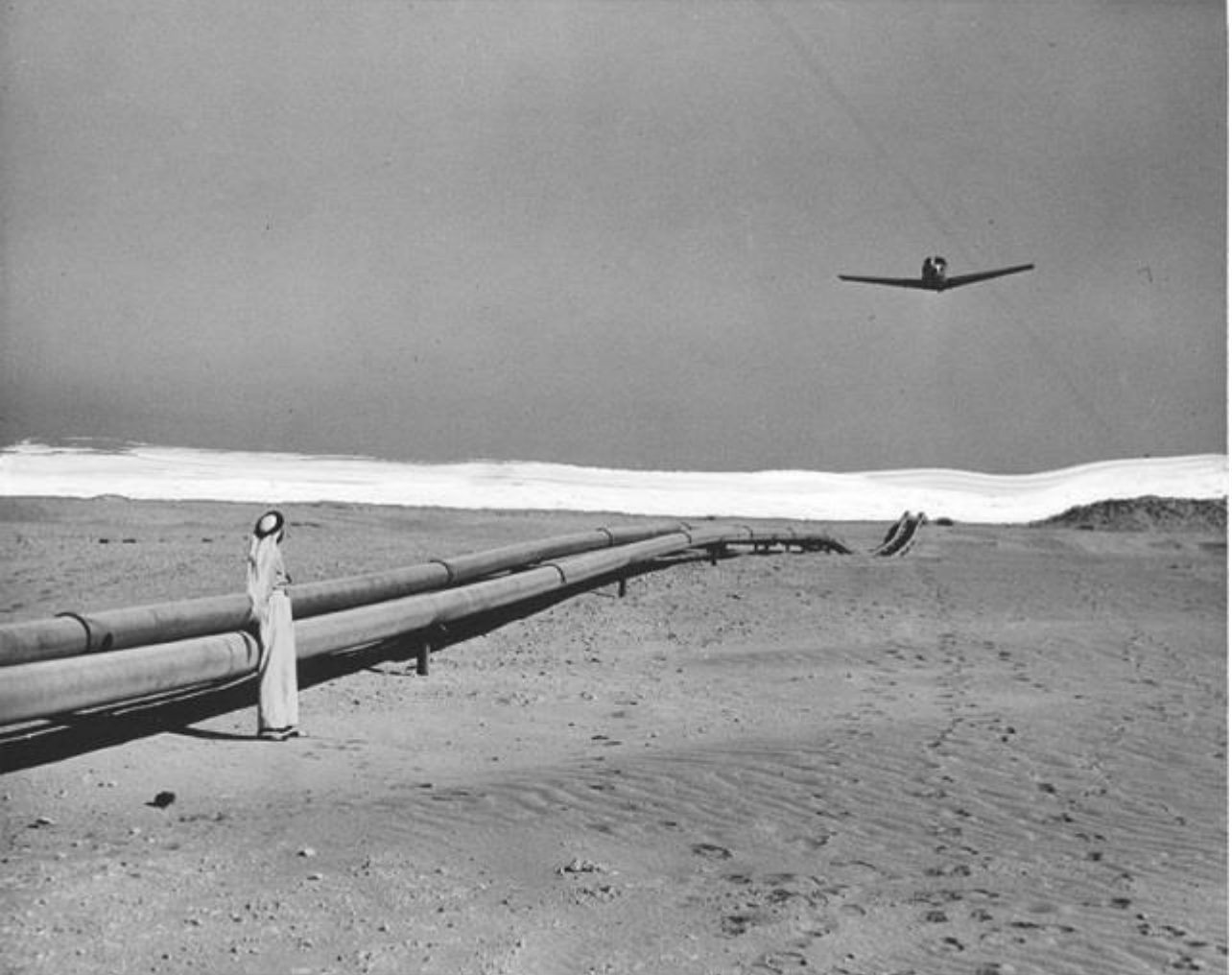
Trans Arap Boru Hattı üzerinde uçuş.

Fakat 1949 yılı Mart ayında Suriye'nin demokratik yöntemlerle seçilen başkanı Shukri-al-Quwatli, bir Amerikan projesi olan ve Suudi Arabistan'daki petrol yataklarını Suriye üzerinden Lübnan limanlarına ulaştırmayı öngören Trans Arap Boru Hattını onaylamakta tereddüt göstermiştir.