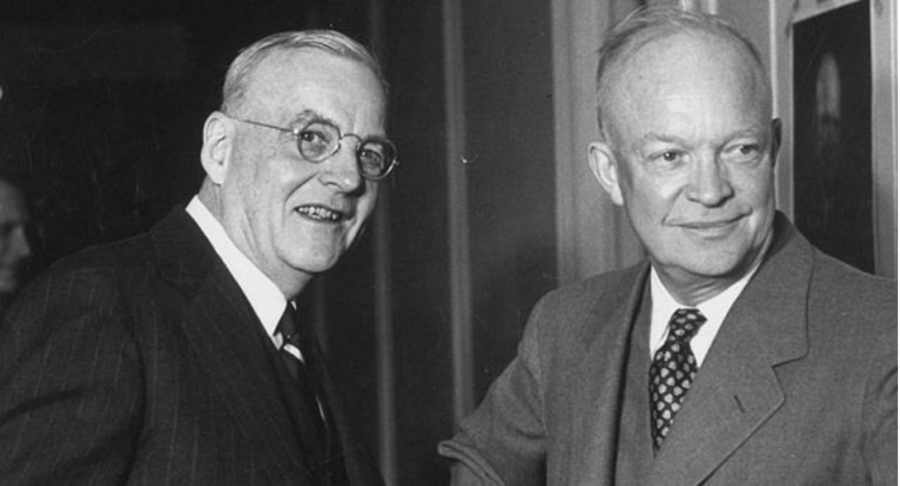
John Foster Dulles (solda) ve Başkan Eisenhower, 1952.