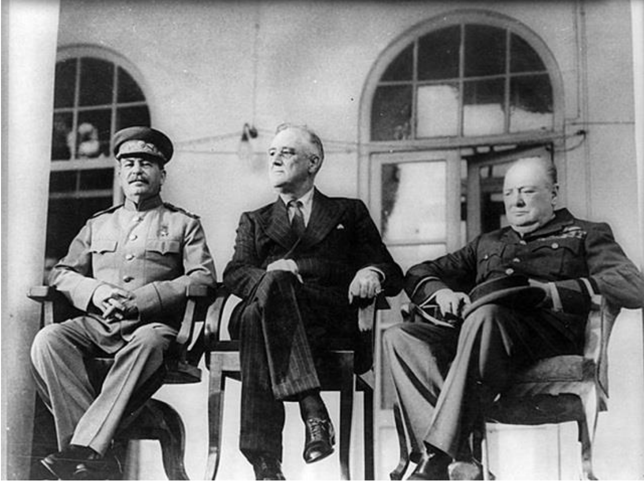
Büyük Üçlü: Josef Stalin, Franklin D. Roosevelt ve İngiltere Başbakanı Winston Churchill 1943 yılında Tahran Konferansında.

Petrol Şirketi (şimdiki adı British Petroleum) ile olan dengesiz sözleşmeleri yeniden müzakere etmeyi denemesi sonrasında düzenlenen bir darbeyi yönetmişlerdir. Mosaddegh, İran'ın 4,000 yıllık tarihinde seçimle iktidara gelen ilk lider ve gelişmekte olan ülkede popüler bir demokrasi destekçisidir.