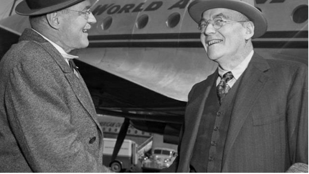
1948 yılında Dulles Kardeşler: Allen (solda) ve John Foster (sağda).

Fakat büyük ölçüde Allen Dulles ve dış politika entrikaları ile sık sık direkt olarak ulusumuzun siyaseti ile ters düşen CIA nedeniyle, Atlantik Bildirisinde ifade edilen idealist yola hiçbir zaman girilmemiştir. 1957 yılında büyükbabam Büyükelçi Joseph P. Kennedy, CIA'nin Orta Doğu'daki örtülü pis işlerini soruşturan gizli bir komitede görev almıştır. Büyükbabamın altında imzası olduğu 1956 tarihli Bruce-Lovett raporu (David Bruce ve Robert Lovett iki deneyimli devlet adamıdır), bütün Araplar tarafından bilinen, fakat görünürde, hükümetin inkâr politikasına inanan Amerikan halkının bilmediği, CIA'nin Ürdün, Suriye, İran, Irak ve Mısır'daki darbe komplolarını açıklamaktadır. Raporda CIA, günümüzde dünyanın birçok ülkesinde görülen ve o zamanlar anlaşılmasız bir biçimde yayılmaya başlayan Amerikan aleyhtarlığına neden olmakla suçlanmaktadır.