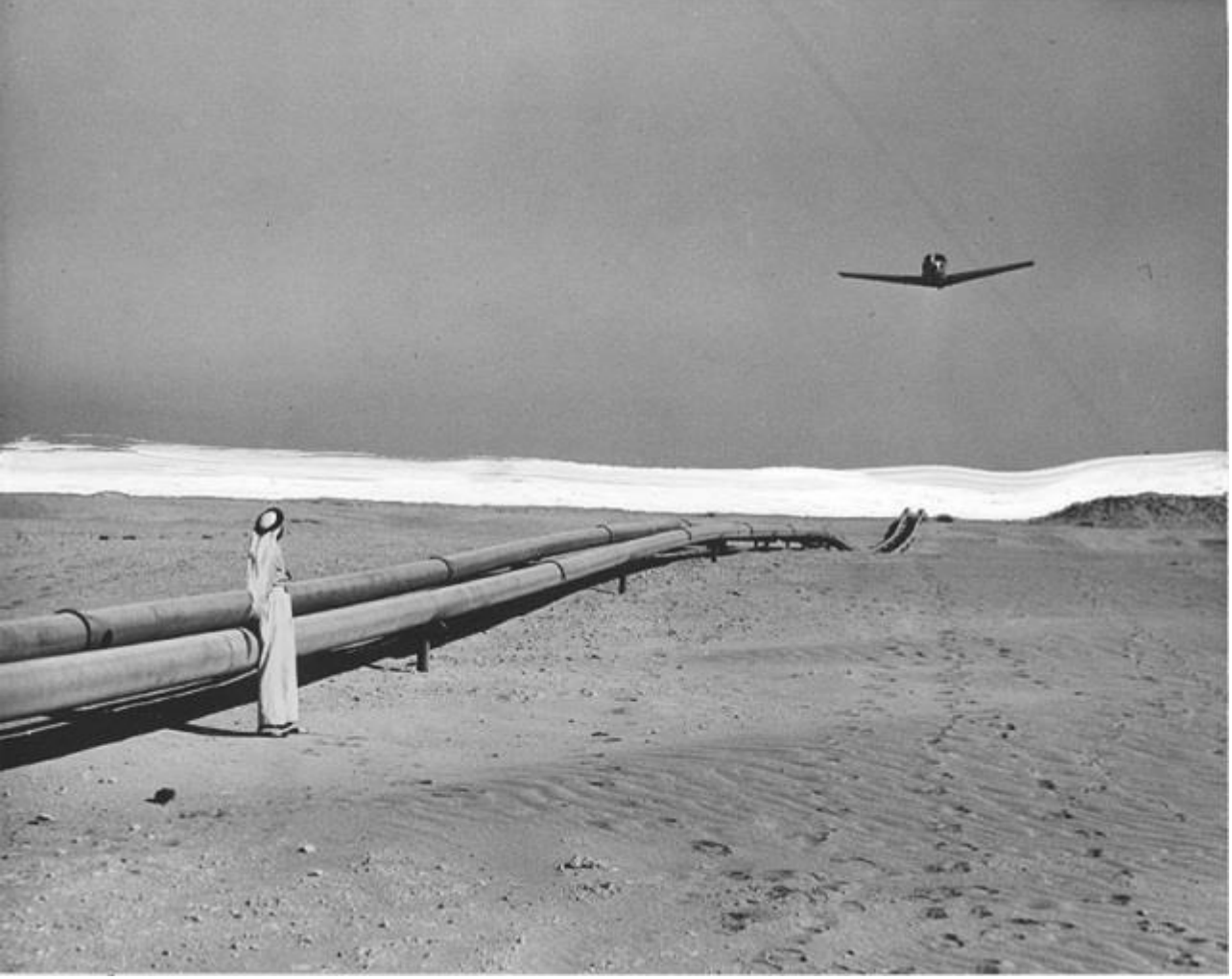
Trans Arap Boru Hattı üzerinde uçuş.

üzerinden Lübnan limanlarına ulaştırmayı öngören Trans Arap Boru Hattını onaylamakta tereddüt göstermiştir.