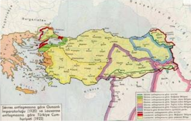
Sevr haritasında bölünen Anadolu toprakarı

Bizler, İstiklal Marşımız söylenirken, ayağa kalkmayan, Milli Marşına saygı duymayan, Bayrağımızın gönderden indirilmesine, Minarelerden Ezan sesinin susmasına, vatanın bölünüp, parçalanmasına, rıza gösterecek kadar alçalan ve keşke İstiklal savaşı kazanılmasaydı da, Cumhuriyet ilan edilmeseydi diyen zihniyette olan vatan hainlerinin bu ülkede yeri olmadığına inanıyor ve Kanunların işletilerek cezalandırılmalarını arzu ediyoruz.