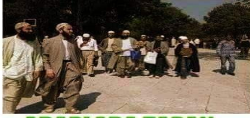
ARAPLARA TAPAN VATAN HAINLERİ

Bunların adları da, dilleri de, kibleleri de Atlantik. Örneğin kendilerine Think Thank Araştırma adını veren bir grup var. Bakınız bu Think Thankçiler, kimliklerini nasıl sergiliyorlar