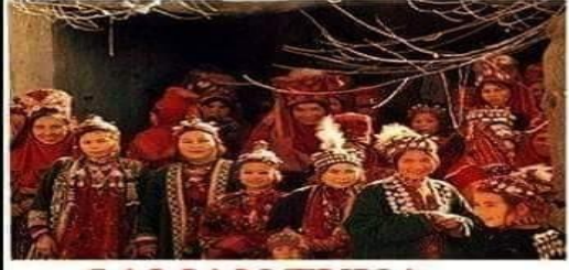
ŞAMAN TUVA TÜRKLERİ