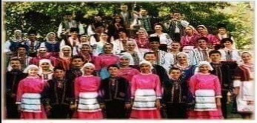
HİRİSTİYAN GAGAVUZ TÜRKLERİ