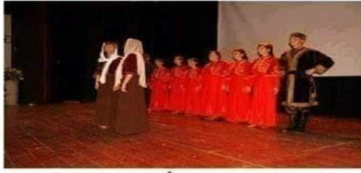
MUSEVİ KARAY TÜRKLERİ